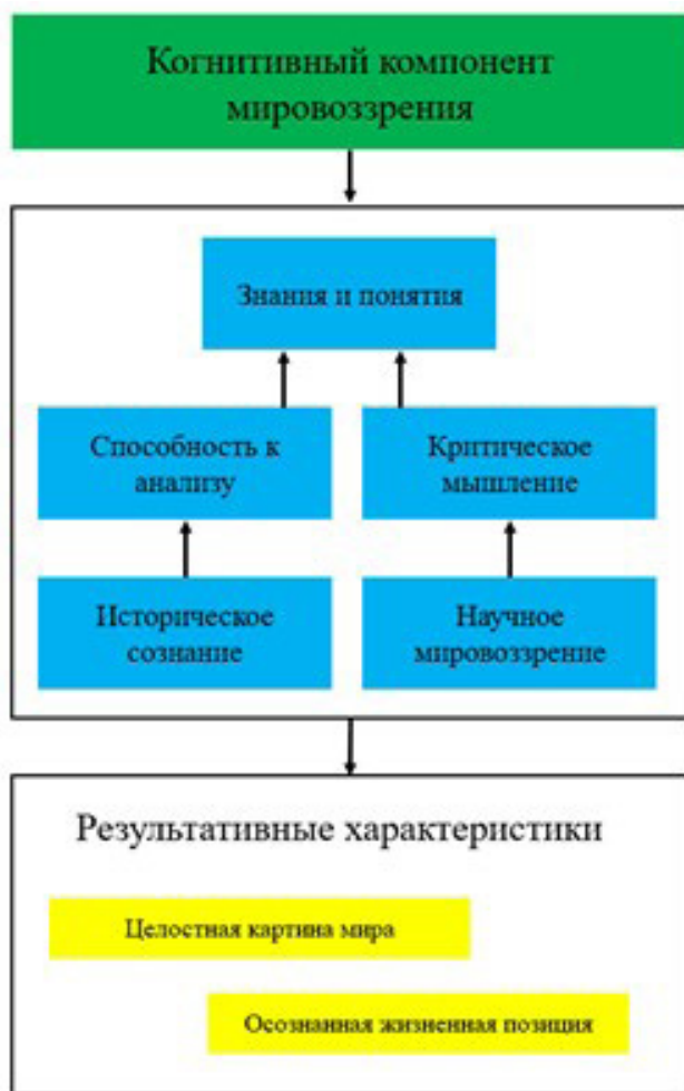
Рис. Система взаимосвязанных элементов когнитивного компонента мировоззрения

Когнитивный критерий в российском образовательном процессе играет фундаментальную роль, выступая важнейшим индикатором сформированности мировоззрения у старшеклассников [5, с. 101]. В контексте современной образовательной парадигмы он проявляется через способность обучающихся не просто усваивать информацию, но и критически ее осмысливать, выстраивать логические связи между различными областями знаний, а также применять полученные знания для анализа сложных социальных и культурных явлений. Российская система образования традиционно уделяет особое внимание развитию именно когнитивных способностей, что находит отражение в структуре учебных программ и методах преподавания гуманитарных и естественно-научных дисциплин [6].